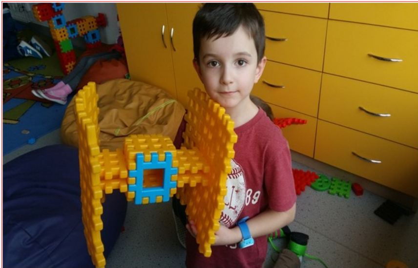
„Super- kosmiczny statek”