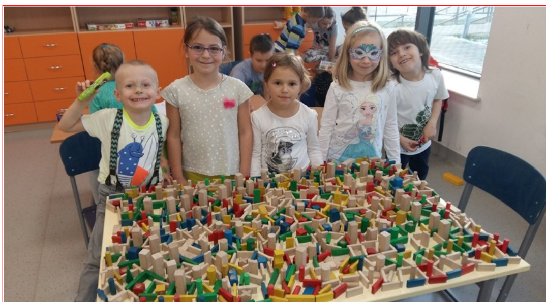
Praca grupowa naszych pierwszoklasistów pt : „Zwariowane miasto”

Atmosfera u nas jest gorąca a praca wre. Nasze „Świetliki” nie marnują ani chwili, wolny czas poświęcają konstruowaniu przeróżnych wymyślnych budowli. Oto przykłady pracy w grupach: