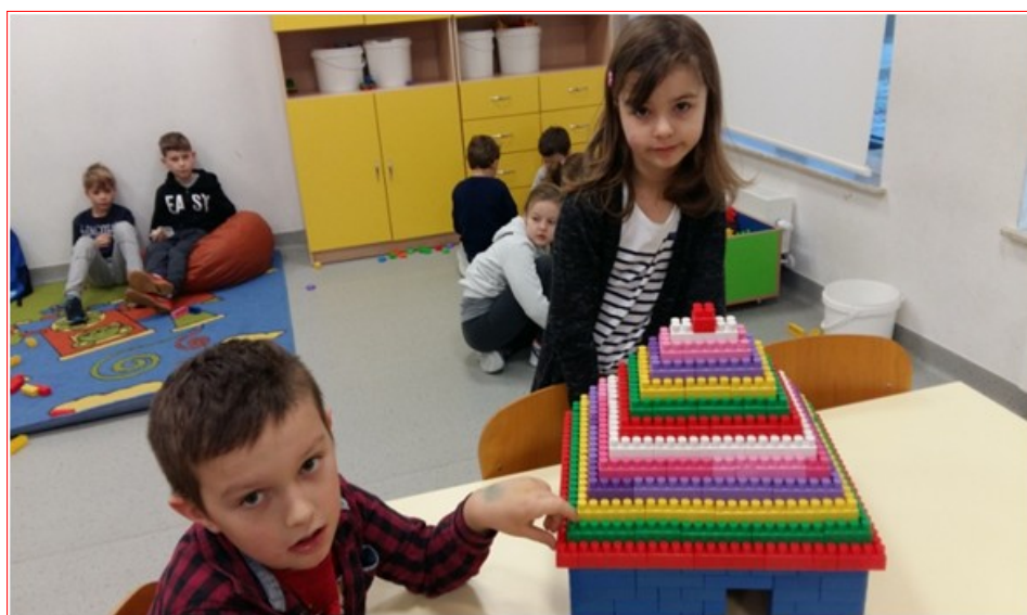
Tytuł pracy: „Tajemnicza budowla- piramida”. Autorami są uczniowie kl. I