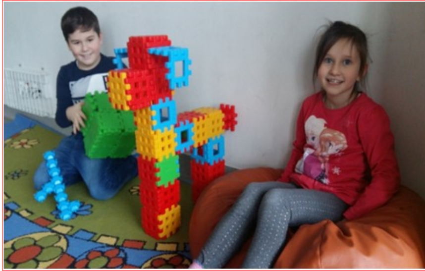
„Towarzyski piesek” -kl. IIE