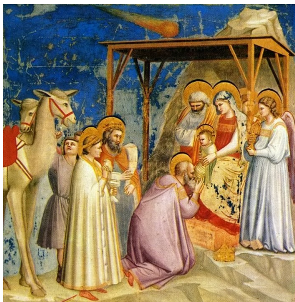
Pokłon Trzech Króli, Giotto

Kim byli ci, którzy wybrali się w daleką i niebezpieczną podróż do Jerozolimy, do miasteczka Betlejem, wiedzeni wieścią o niezwykłym wydarzeniu, o narodzeniu Syna Bożego?