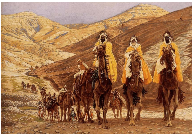
Podróż Magów, James Tissot

Na pamiątkę tego wydarzenia 6 stycznia obchodzimy święto Objawienia Pańskiego . Jest to jedno z najstarszych świąt w Kościele. W ostatnich latach, w wielu miastach Polski, również w Rzeszowie, obchodzimy je bardzo uroczyście i rodzinnie, biorąc udział w ulicznej paradzie nazywanej Orszakiem Trzech Króli .